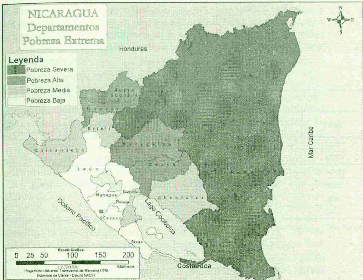
Indicadores de la pobreza extrema por hogar según departamentos