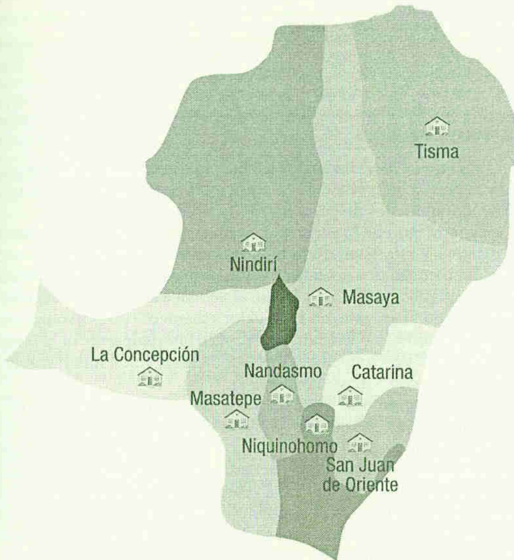
Mapa 2 Municipios del Departamento de Masaya